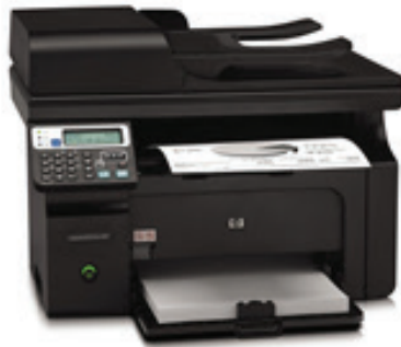
Kopir aparat, skener, printer i fax aparat