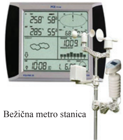
Bežična metro stanica