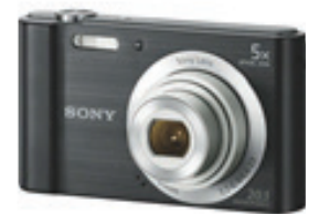
Digitalni foto aparat