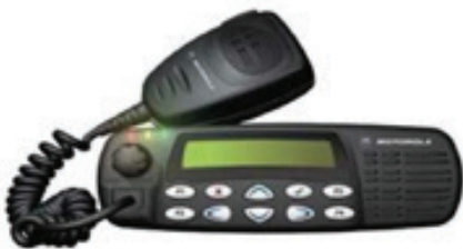
Fiksna UKV stanica sa deset prenosnih uređaja (motorola)