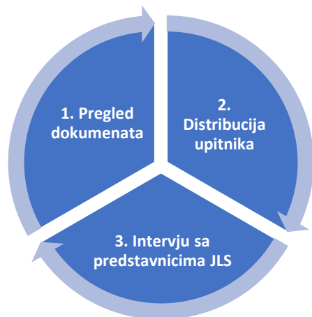
Grafikon 1 - Triangulacija u analitičkom pristupu

U prvom koraku je izvršen detaljan pregled dokumenata dostavljenih od strane JLS. Potom su, u narednom koraku, dodatni podaci prikupljeni distribucijom jedinstvenog upitnika koji su popunili predstavnici JLS u ReLOaD2 projektu. Konačno, obavljen je i on-line intervju sa predstavnicima JLS.